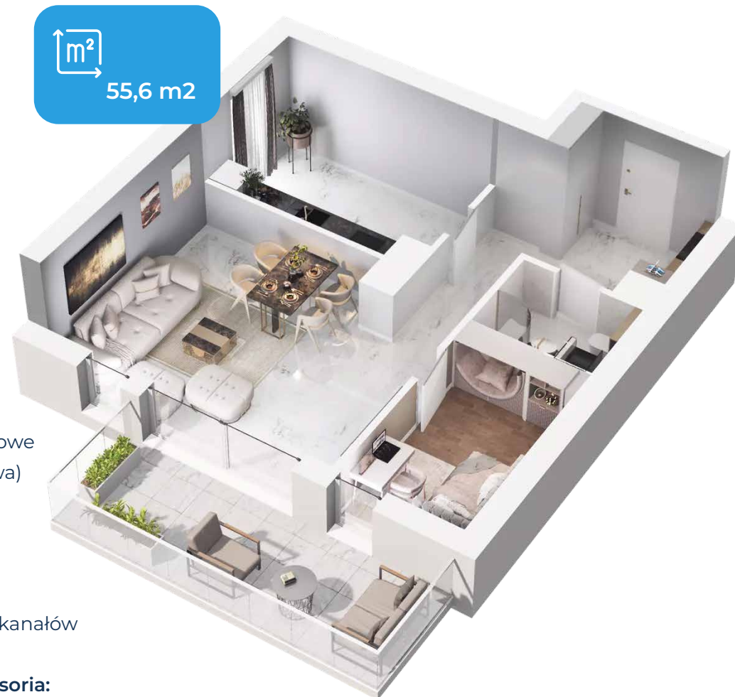
Przykładowy apartamentu typu Family