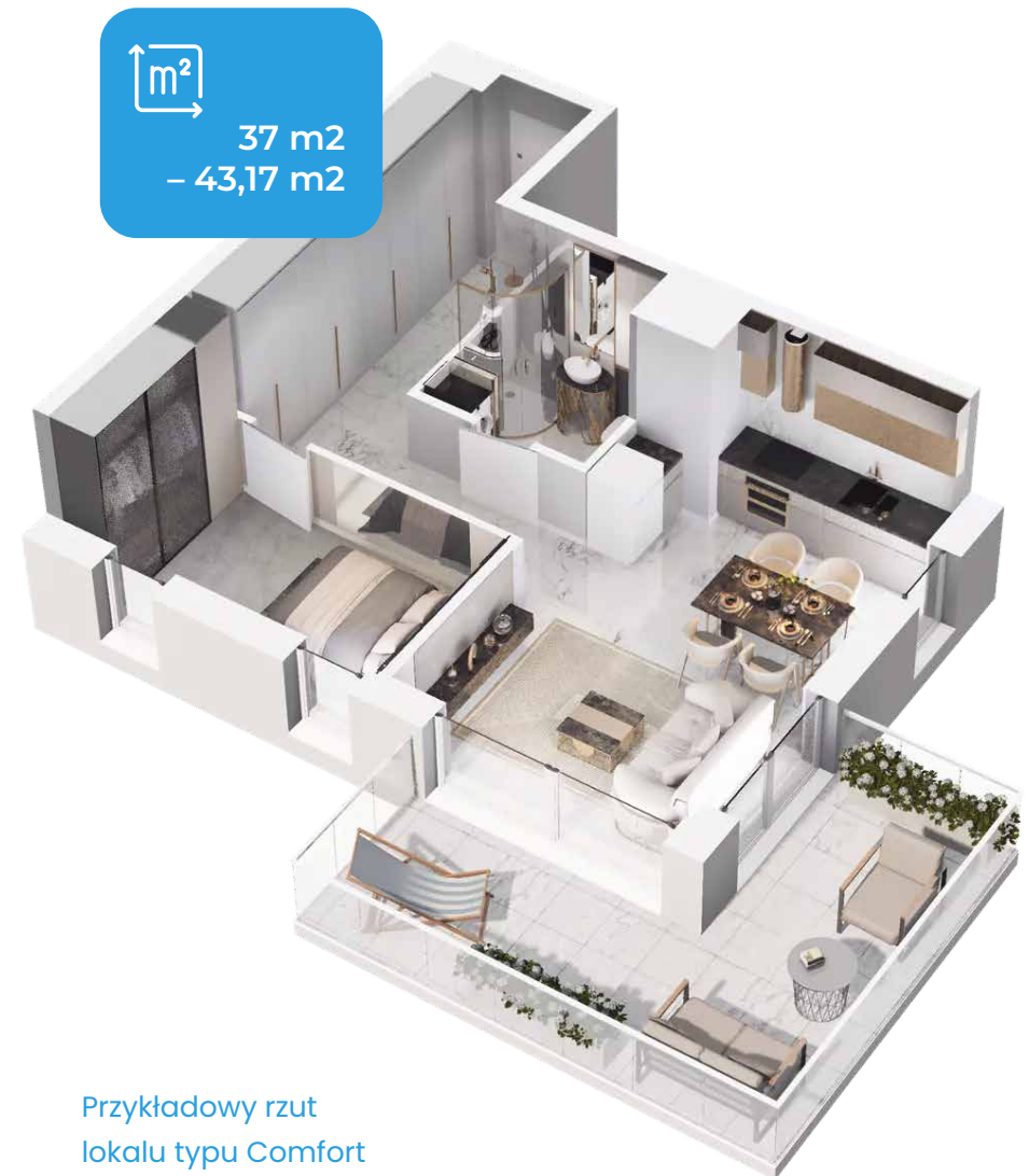
Przykładowy rzut lokalu typu Comfort