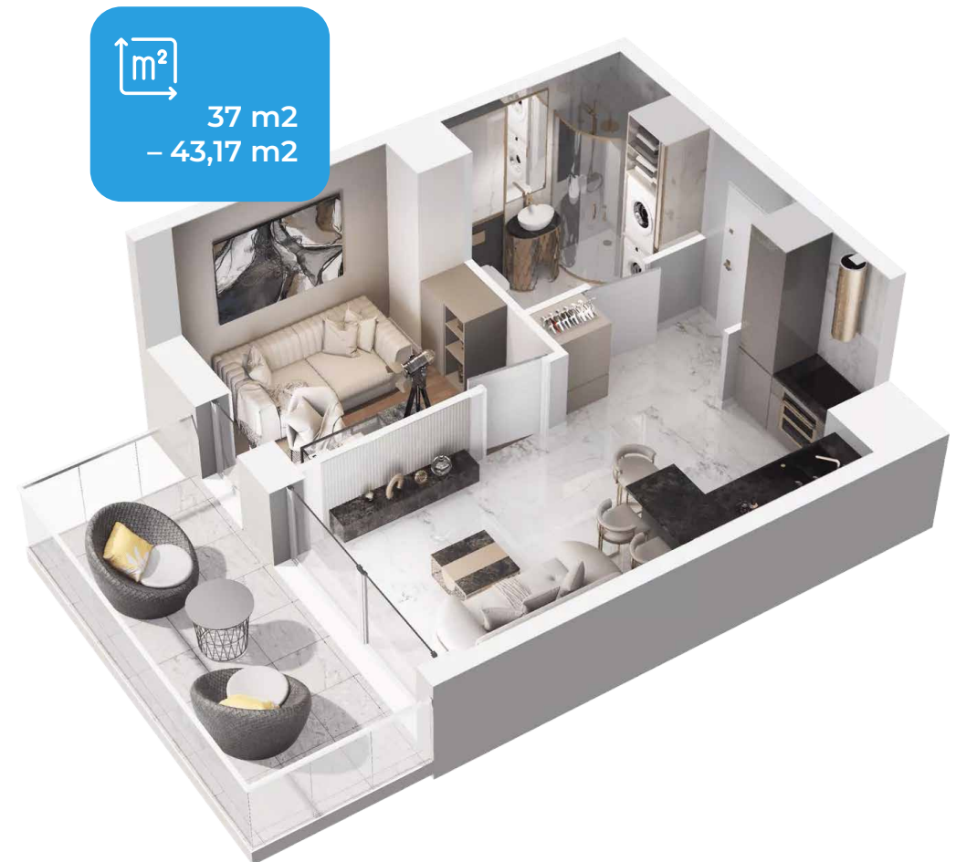
Przykładowy rzut lokalu typu Comfort